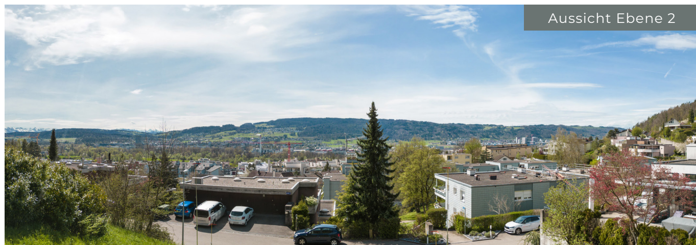
Aussicht Ebene 2